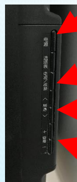
菜单按钮 选择后确认 上下移动 左右移动