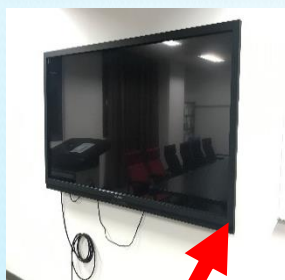
电源按钮及 菜单操作按钮